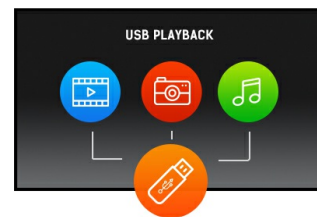
Odtwarzanie z nośnika USB

Technologia VA gwarantuje wyższy kontrast, lepsze odwzorowanie barw i większe kąty widzenia niż najbardziej popularna technologia TN. Obraz będzie wyglądał dobrze niezależnie od tego, pod jakim kątem na niego patrzymy.